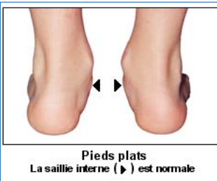
Pieds plats La saillie interne (▶) est normale

Les voûtes plantaires ont aussi une morphologie évolutive avec la croissance. Jusqu'à l'âge de 8 ans, la tendance naturelle est au pied plat . Cette situation est courante, banale, et indolore. La voûte plantaire se creuse progressivement dans la période préadolescente pour prendre l'aspect que l'on connaît chez l'adulte.